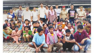
68 girls from Assam has been released from Mumbai Children Home and reunite with their family