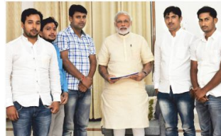
माय होम इंडिया, वाराणसी ईकाई के युवाओं द्वारा संचालित स्वच्छ काशी-स्वच्छ काशी अभियान की प्रधानमंत्री जी ने सराहना की