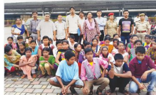
असम की 68 आदिवासी लड़कियों को मुंबई के बालगृह से छुड़ाकर घर पहुंचाया