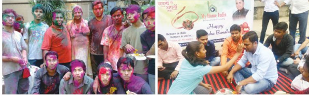
Holi celebration with north eastern people, Mumbai-2009