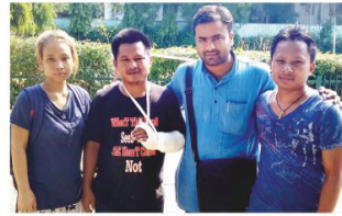
Helpline to Rinkhulan from Manipur, Delhi – 2015