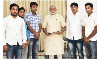
PM Narendra Modi Ji appreciated Swachh Kashi-Swasth Kashi Abhiyan being run by youths of MHI Varanasi Unit