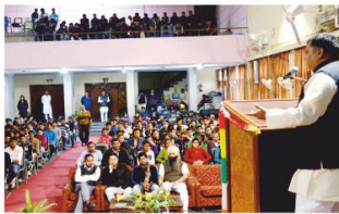
पूर्वोत्तर के प्रति जागृति, बंड़ीगढ़ - 2014