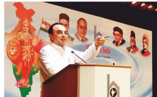
राष्ट्रवाद पर मंथन कार्यक्रम, श्री शुभमनियन स्वामी, दिल्ली-2016