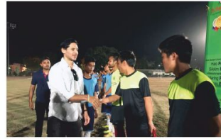
Actor Dino Morea, Fraternity Cup Delhi – 2017