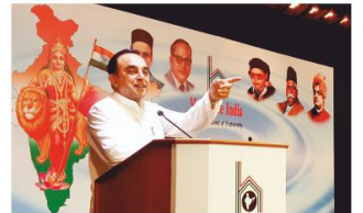
Rashtravard Par Manthan Program, Shri Subramanian Swamy, Delhi-2016