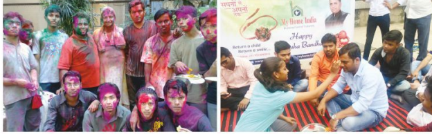
पूर्वोत्तरवासियों के साथ होली, मुंबई-2009