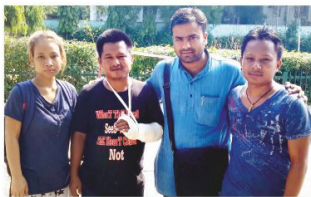
मणिपुर के रिखुलन को हेल्पलाइन, दिल्ली - 2015