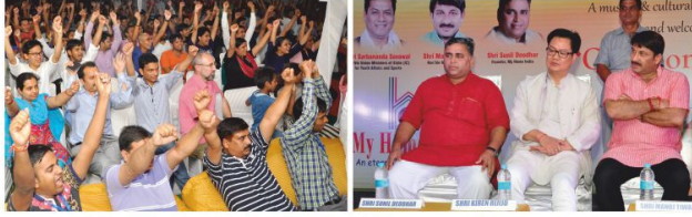
श्री किरेन रिजिजू जी, श्री मनोज तिवारी जी की उपस्थिति में वन बान्ड-वन इंडिया, जेएनयू, दिल्ली-2015