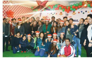
Advent Christmas Celebration, Delhi – 2016