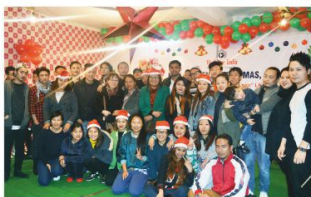
एडवेंट खिसमस सेलिब्रेशन, दिल्ली - 2016