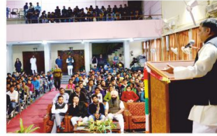
Awareness about North East, Chandigarh – 2014